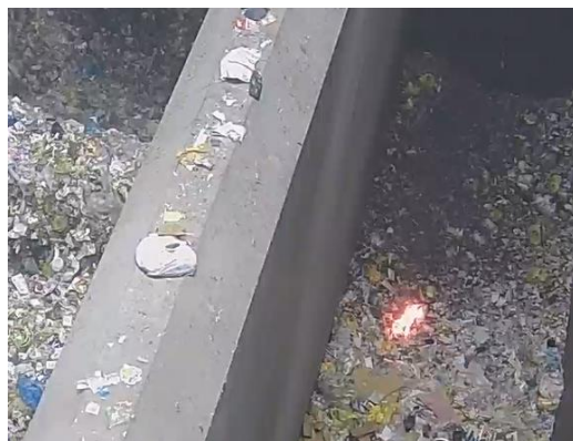
ごみピットにおいて発火がありました

令和8年2月4日10時35分頃、クリーンセンターあがのがわのごみピット内において電池類が原因とみられる発火がありました。すぐに消火しましたが火災につながる可能性もありました。